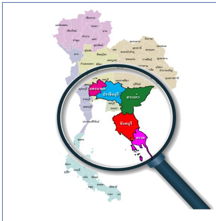
รูปภาพที่ 1 กลุ่มจังหวัดในพื้นที่รับผิดชอบของสำนักงานศึกษาธิการภาค 9

จังหวัดสระแก้ว มีพื้นที่ 7,159 ตารางกิโลเมตร ประกอบด้วย 9 อำเภอ ได้แก่ อำเภอเมืองสระแก้ว อำเภอวังน้ำเย็น อำเภอเขาฉกรรจ์ อำเภอกลองหาด อำเภอวังสมบูรณ์ อำเภอตาพระยา อำเภอวัฒนานครอำเภออรัญประเทศ และอำเภอโคกสูง มี 59 ตำบล 731 หมู่บ้าน 16 เทศบาล 66 องค์การบริหารส่วนตำบล และ 1 องค์การบริหารส่วนจังหวัด