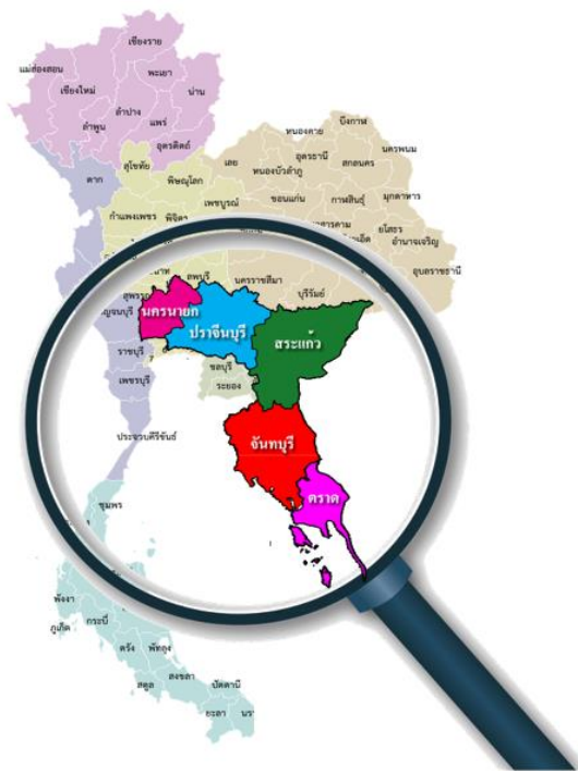
รูปภาพที่ 1 กลุ่มจังหวัดในพื้นที่รับผิดชอบของสำนักงานศึกษาธิการภาค 9