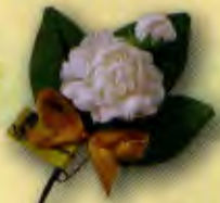
1 ช่อมะลิ “รักแม่” ราคา 10.- บาท