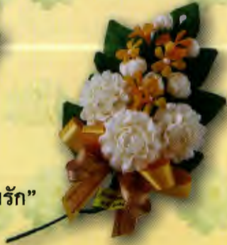
3 ช่อมะลิ “ร้อยรวมรัก” ราคา 50.- บาท