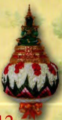
13 พานพุ่มดอกมะลิ

ขนาดพาน 8 นิ้ว ราคาพานละ 2,000.- บาท ค่าจัดส่งพานละ 100.- บาท