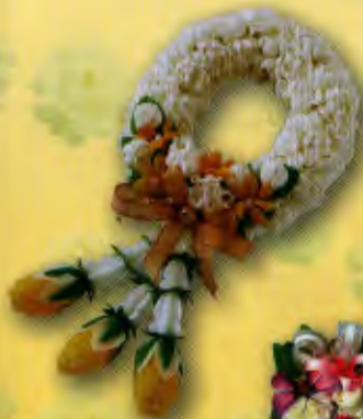
8 มาลัยรัก....จากลูก ราคา 300.- บาท