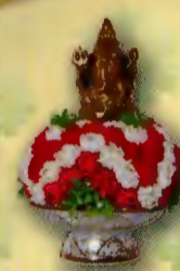
10 พานพระพินเนศวร พานพระพุทธรโสธร ขนาดพาน 3 นิ้ว ราคาพานละ 499.- บาท