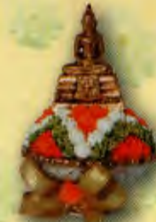
11 พานพระแก้วมรกต (ตุ๊กร่อน) ขนาดพาน 5 นิ้ว ราคาพานละ 1,400.- บาท