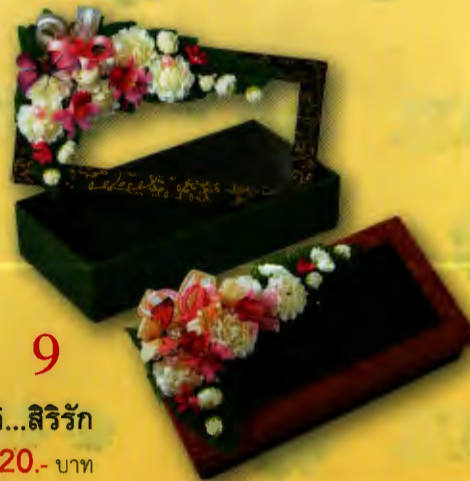
9 กล่องมะลิ...สิริรัก ราคา 320.- บาท