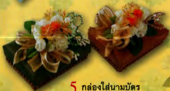
5 กล่องใส่นามบัตร ราคา 180.- บาท