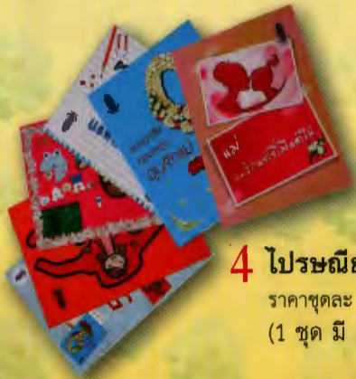
4 ไปรษณียบัตรภาพ..ส่งรักให้แม่ ราคาชุดละ 50.- บาท (1 ชุด มี 5 ภาพ)