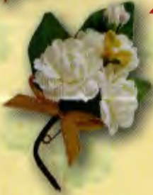
2 ช่อมะลิ “รวมใจรักแม่” ราคา 20.- บาท