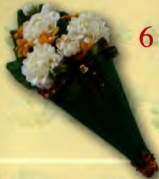
6 กรวยดอกไม้...ใส่รัก ราคา 190.- บาท