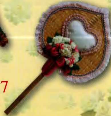
7 พัดการบูร...จำรูญรัก ราคา 250.- บาท